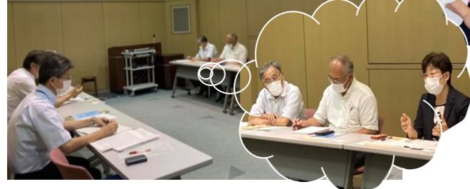
◀⑦県立中央病院長と懇談。地域医療に果たす病院の実情と要望をお聞きする (8/19)